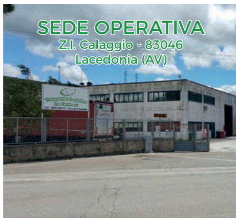
SEDE OPERATIVA Z.I. Calaggio - 83046 Lacedonia (AV)