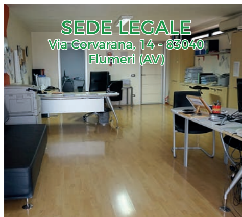
SEDE LEGALE Via Corvarana, 14 - 83040 Flumeri (AV)