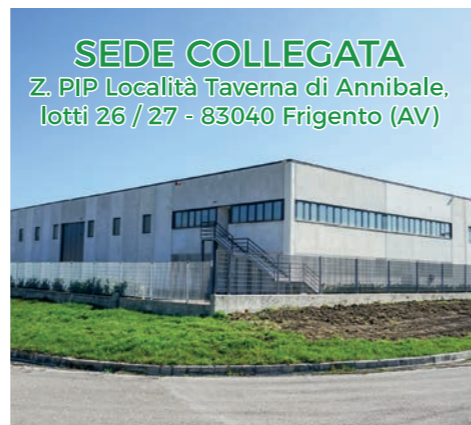
SEDE COLLEGATA Z. PIP Località Taverna di Annibale, lotti 26 / 27 - 83040 Frigento (AV)